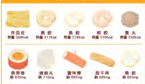
食材熱量 / 鈉含量排名

國健署調查市售加工火鍋料發現，以100公克為比較基準，熱量最高是炸豆皮358大卡，第二至第五名的燕餃、魚餃、蝦餃、貢丸也各有200~300大卡。鈉含量最高前五名是魚卵卷、旗魚丸、蟹味棒、甜不辣及魚餃，各有600多至800多毫克。