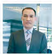
伯慶股份有限公司 董事長

大家一起從「1」開始，只要做好「1」件事，簡單的完成每天的小目標，就能輕鬆實現十年的大夢想！