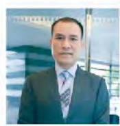
伯慶股份有限公司 董事長

「啊，原來你比螢幕中的看起來更瘦、更年輕、更漂亮耶！」到時候見面時，你可以這麼說！