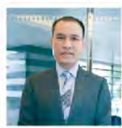
伯慶股份有限公司 董事長

想一想，當下的生活型態，很可能就是未來的生活常態，隨時都可能發生你預測之外的風險，但風險不可怕，可怕的是你沒準備好面對它！